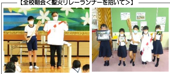
【全校朝会<聖火リレーランナーを招いて>】

PTA全体会<7月9日(金)>では、今年度はじめての授業参観・学級PTAを行ったり、地区懇談会・PTA各専門委員会等を開催したりすることになっています。PTA全体会では、1学期の学校の取組の様子について説明させていただくとともに、夏休み中の新型コロナウイルス感染に係る取組、交通安全・不審者対応等など、安全・安心に係るお願いもさせていただきます(夏休み前に学校で指導)。感染対策をしていただき多数の皆様が参加されますように、よろしく願いいたします。