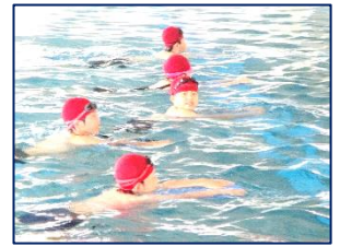
水泳の授業の一コマ

1年生は、育てているアサガオが一気に生長し、毎朝咲いている鮮やかな色の花を楽しんでいます。4年生のヒョウタンは白い花を咲かせ、数個の実は日に日に大きくなっています。2年生は畑のオクラやキュウリ等の夏野菜の収穫を楽しみにして世話をしています。すくすく学級は「おばけかぼちゃ」の苗を植え2年ぶりの大きなカボチャ作りに意欲的です。6年生はジャガイモを植え、理科学習に活用しています。