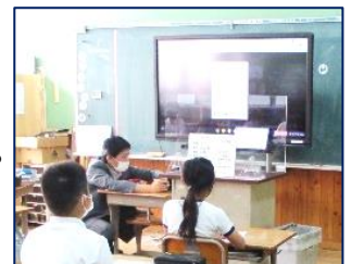
校長先生のお話を聞く4年生