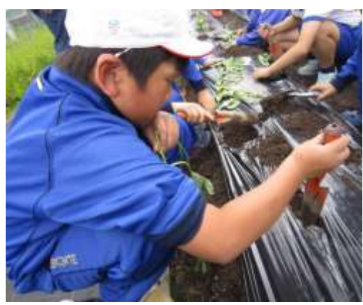
鳴門金時を植えます。

6月20日(月), 1・2年生は芸北分校の高校生に野菜の植え方や世話の仕方を教えてもらいました。高校生が優しくしてくれて、1・2年生はとってもうれしそうでした。野菜がぐんぐん大きくなるように、毎日交代で水やりを頑張っています。