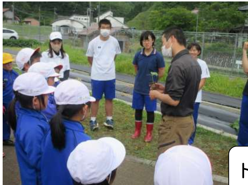
そうそう。上手だよ。