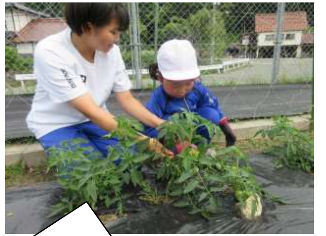
トマトのお世話をしよう。