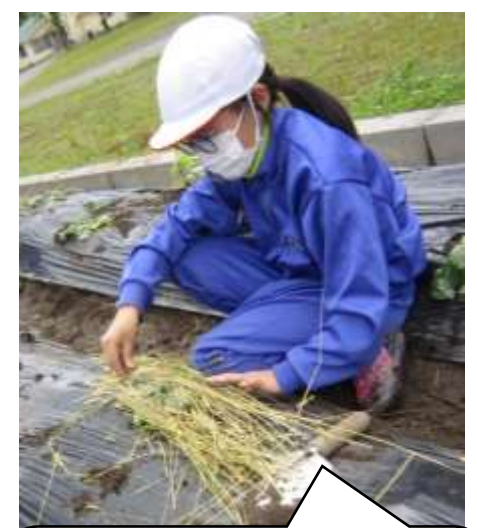
わらを置いたらできあがり!